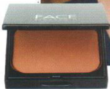
Bronzer „Nr. 1 Ibiza“ von Face Stockholm , ab 30 Euro.

Endlich ist der Frühling da und damit die beste Zeit, um mit der Sonne um die Wette zu strahlen. Die Geheimwaffe der Make-up-Artists von Balmain, Isabel Marant oder Paul & Joe: Bronzer. Er lässt winterblasse Haut im Handumdrehen strahlen und schenkt selbst dem hellsten Teint einen sonnengeküssten Look.